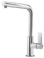
Mitigeur Omega Plus 8497 020