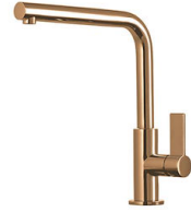
Mitigeur Omega Copper 8497 400